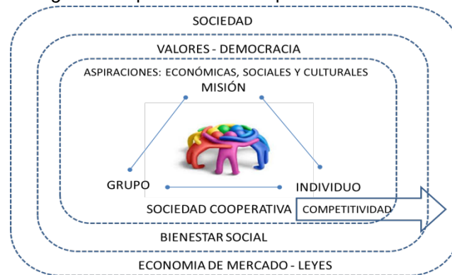
Figura 1: Importancia de cooperativa social